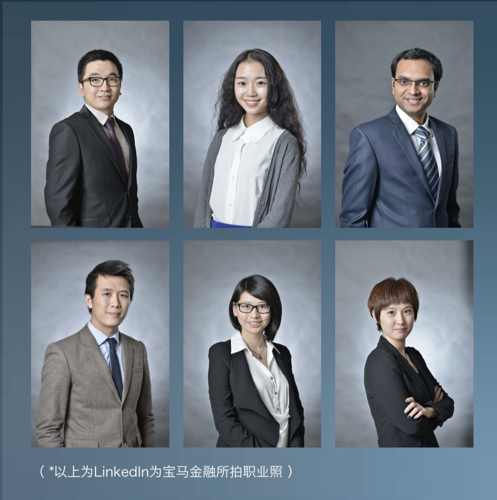
(*以上为LinkedIn为宝马金融所拍职业照)