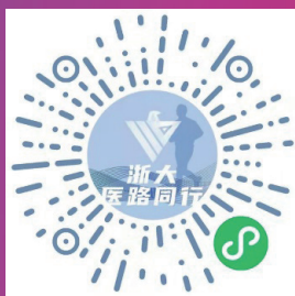
醫路同行小程序二維碼

備註：打卡線路不設起點終點，線路範圍內都可以開始或結束，同線路可以進行多次打卡，最後歸納於個人總成績內並獲得獎狀。